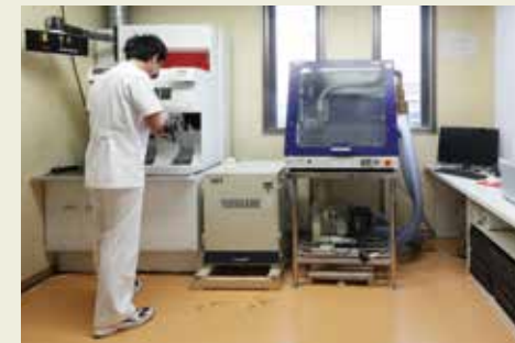
最新のドイツ製CAD-CAMシステムを備えたインソール製作室。採型・画像加工・削り出しまでコンピューターによる一貫作業が可能