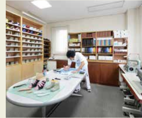
職人が真ใจこめて製作している靴製作室