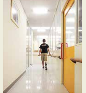
義足・装具の装着具合をその場で確認できる試歩行室