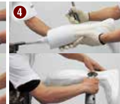
トリミングカット