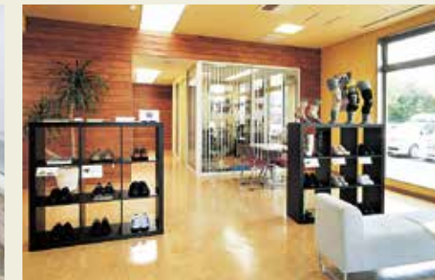
バリエーション豊かな商品を取り揃えたコンフォートシューズコーナー