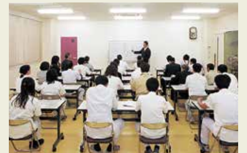
各種セミナーや勉強会を行なえる会議室