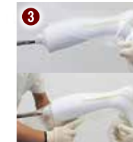
プラスチック真空成型