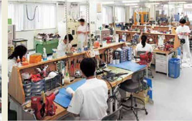
クリーンで明るい製作現場